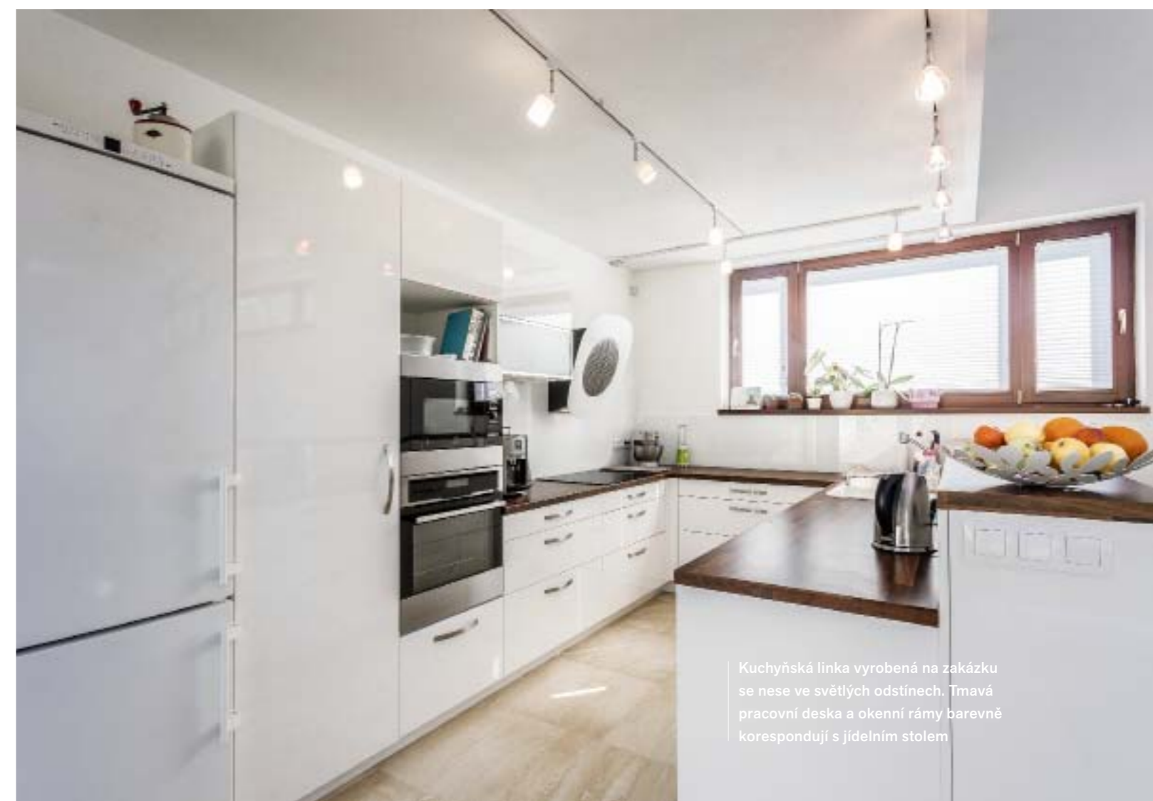
Kuchyňská linka vyrobená na zakázku se nese ve světlých odstínech. Tmavá pracovní deska a okenní rámy barevně korespondují s jídelním stolem