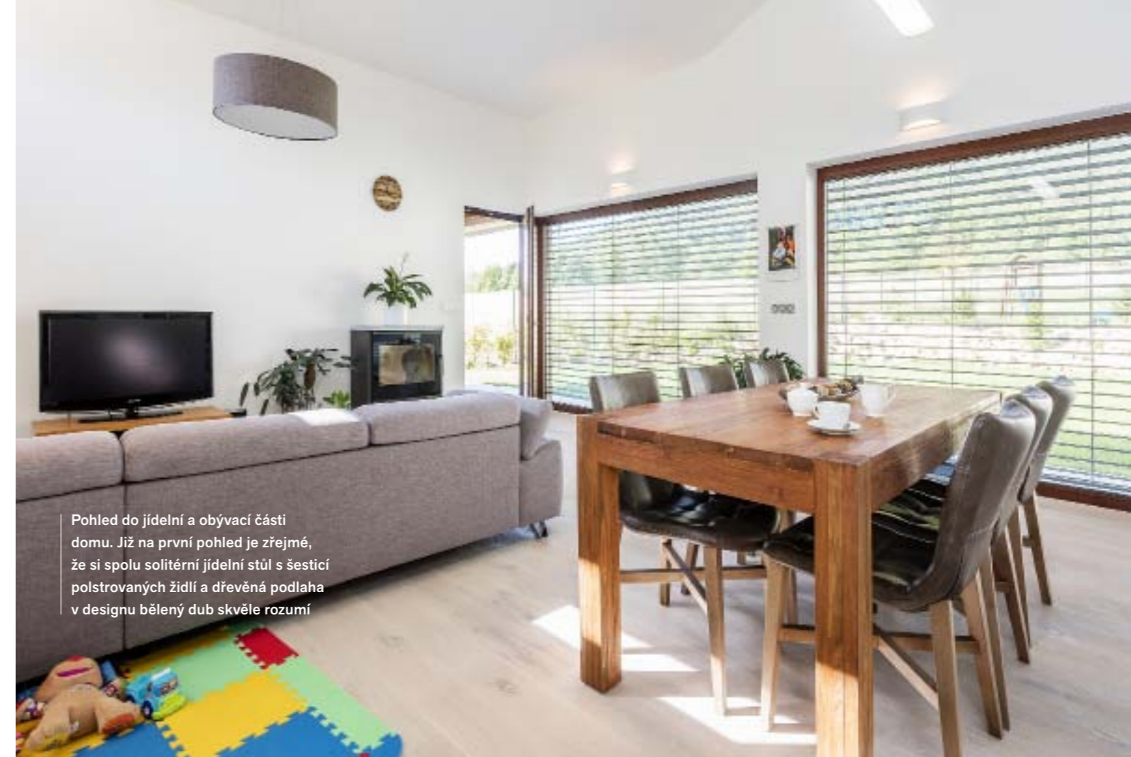
Pohled do jídelní a obývací části domu. Již na první pohled je zřejmé, že si spolu solitérní jídelní stůl s šesticí polstrovaných židlí a dřevěná podlaha v designu bělený dub skvěle rozumí

Po vstupu do domu se ocitnete ve vstupní hale, kde se prostor domu o půdorysu ve tvaru „T“ dělí na obytnou a technickou část. Na levé straně se nachází spížírna, zděné schody do patra a kuchyně spojená s jídelnou a obývacím a s vchodem na terasu. Na pravé straně najdete WC, koupelnu a dětský pokoj